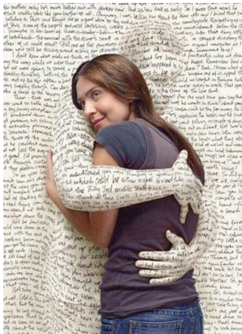
Figura 4: Os efeitos das palavras

Fonte: REDE HUMANIZASUS. < http://www.redehumanizaus.net/4404-palavras-desgastadas >. Acesso em: 15 fev. 2012.