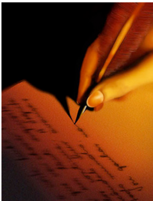
Figura 3: Escrever...