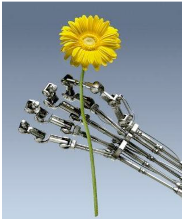
Figura 12: Composições híbridas