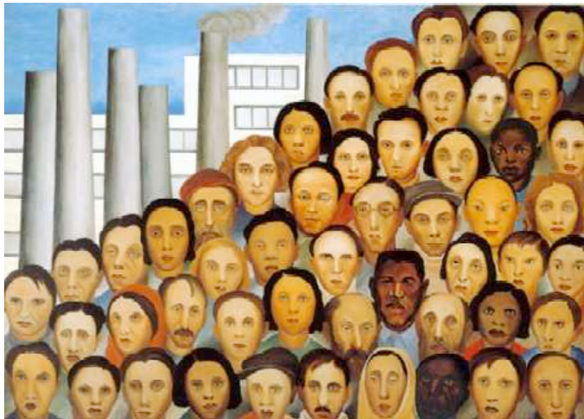
Figura 9: Outros cenários e outros modos de produzir