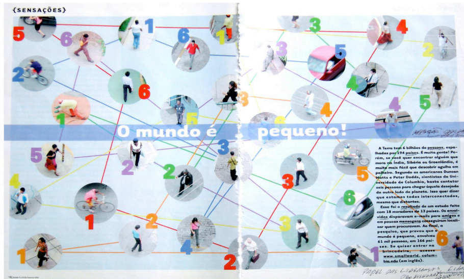
Figura 1: Conexões possíveis