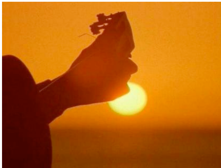
Figura 7: A arte da afetação