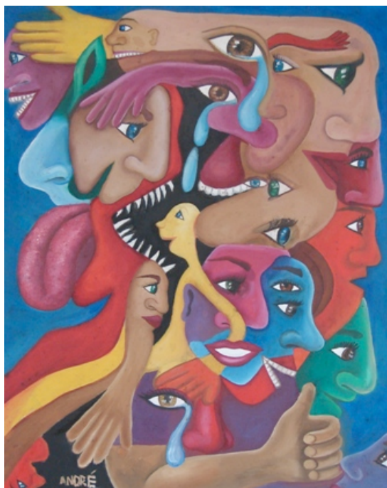
Figura 5: Diálogos