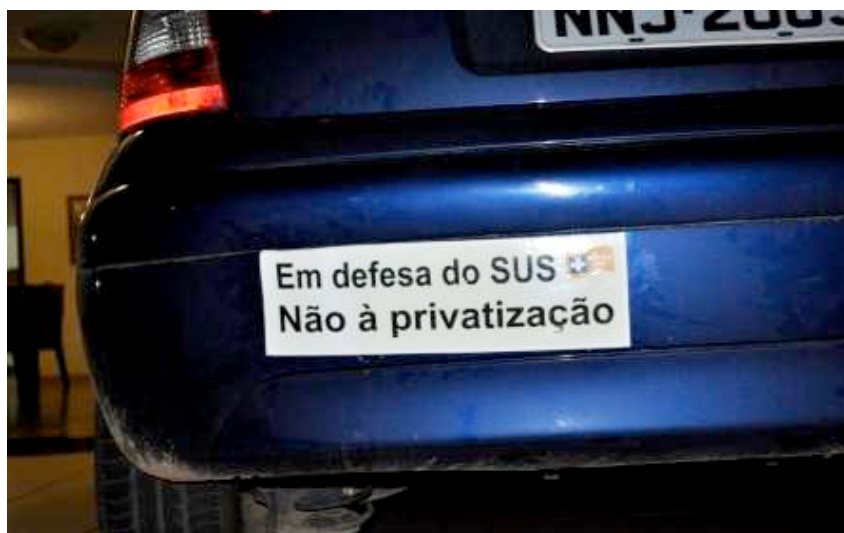
Figura 2: Articulação na Rede – repercussão nas ruas