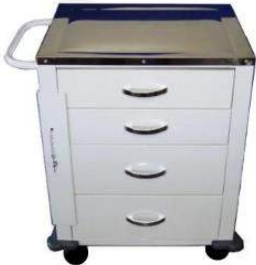
Figura 1: Carrinho de emergência