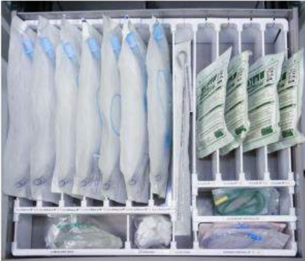
Figura 5: Gaveta acesso vias áreas