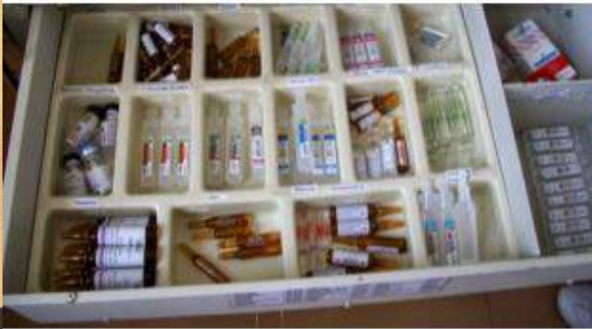
Figura 3: Gaveta dos medicamentos