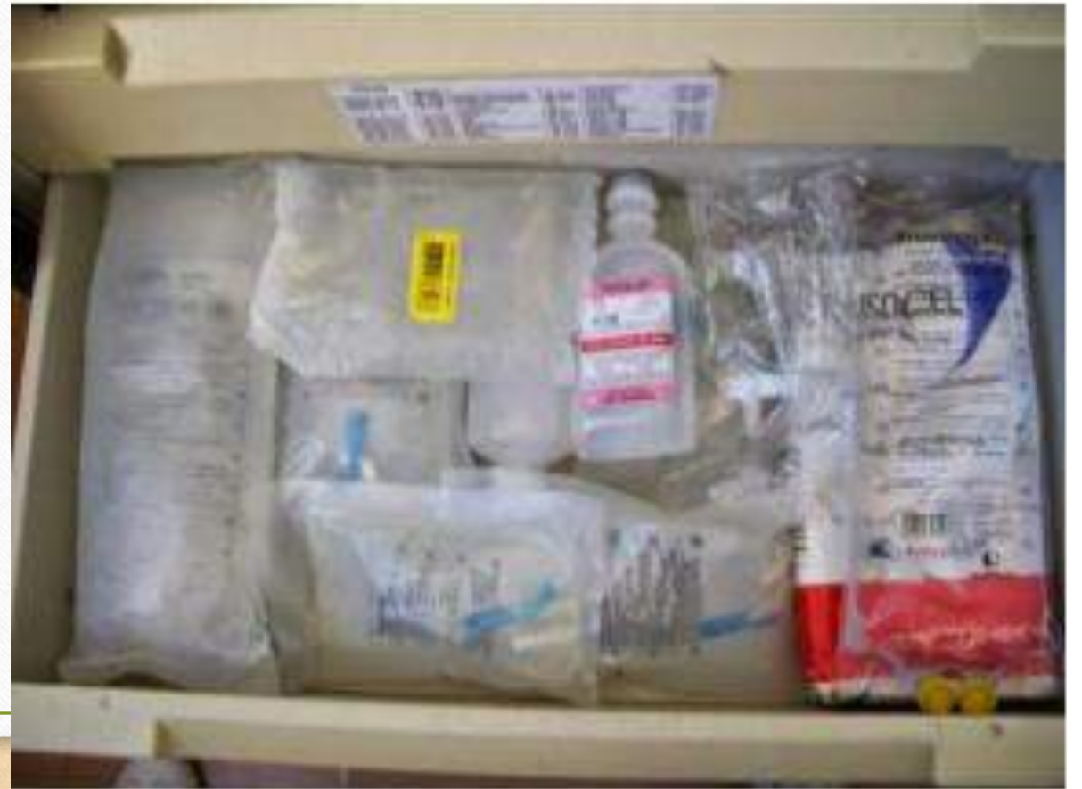
Figura 6: Gaveta variados